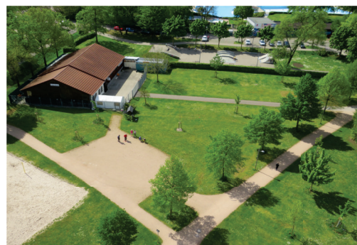
Feldscheune in Kehl