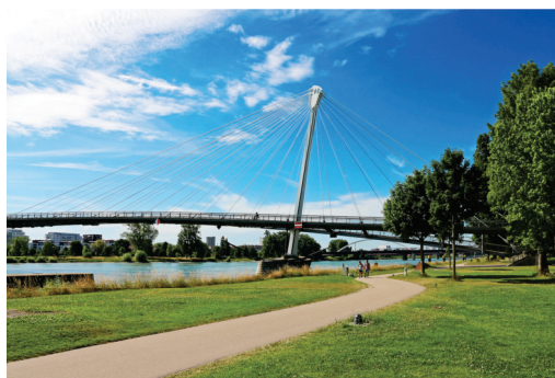
Brücke der zwei Ufer