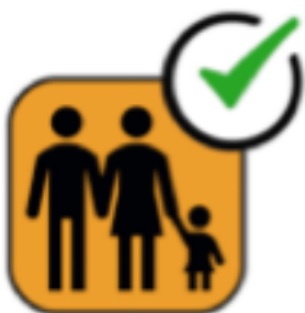
Familien-Freundliche IVV- Wanderstrecke

Sie können unsere Piktogramme von der Homepage des IVV-Europa herunterladen.